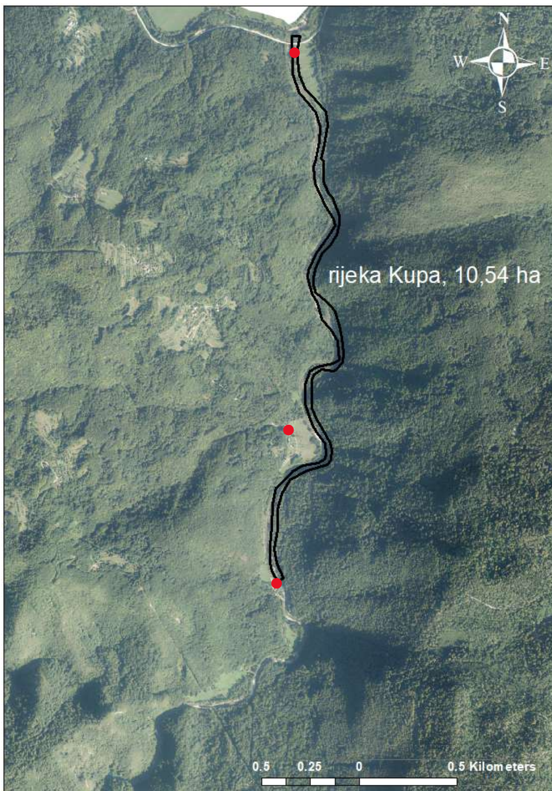
Slika 5.1.1. Digitalna ortofoto karta rijeke Kupe s procijenjenom površinom. Crne linije označavaju odsječak na kojem je dozvoljen ribolov, a crveni krugovi označavaju mjesta na kojima su pozicije oznaka ribolovnih zona.