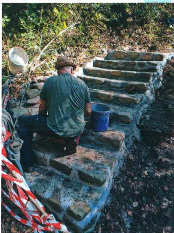
Izrada stepenica prema izvoru Kupe

Na studijsko putovanje stigli su i turistički vodiči iz Udruge turističkih vodiča Kvarnera što nam je vrlo važan vid promocije parka i unutar turističkog sektora u županiji.